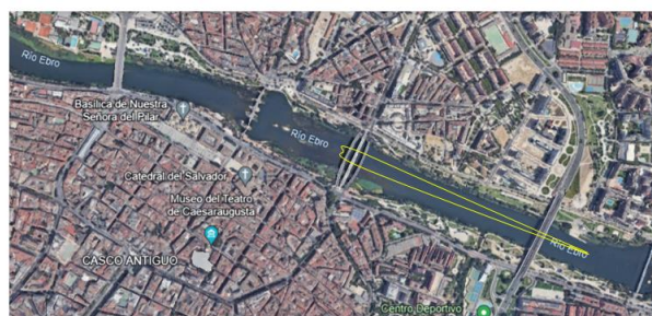
VUELTA (AMARILLA): 2 KM

←Parte del descenso lineal + vuelta pequeña abajo: